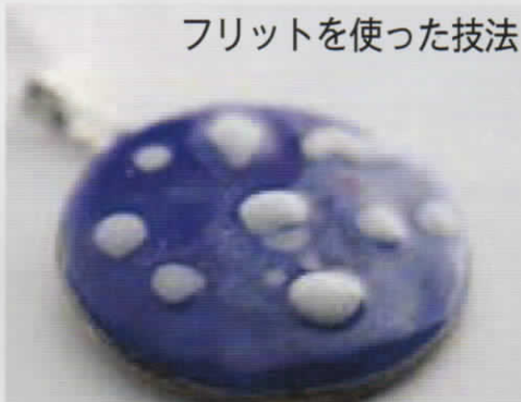
フリットを使った技法